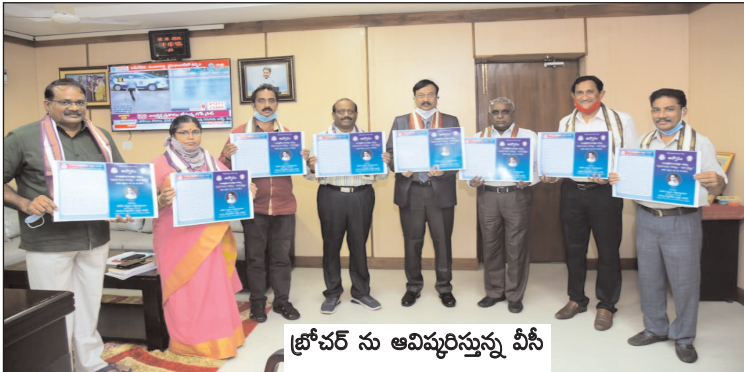
ట్రోఫర్ ను అవిష్కరిస్తున్న వీసీ